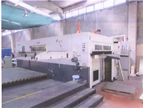
4) Levha Kesim Makinesi