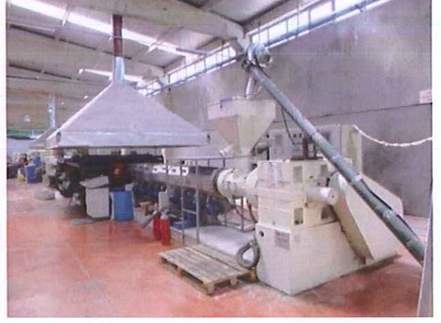
1) Üretim Hattı