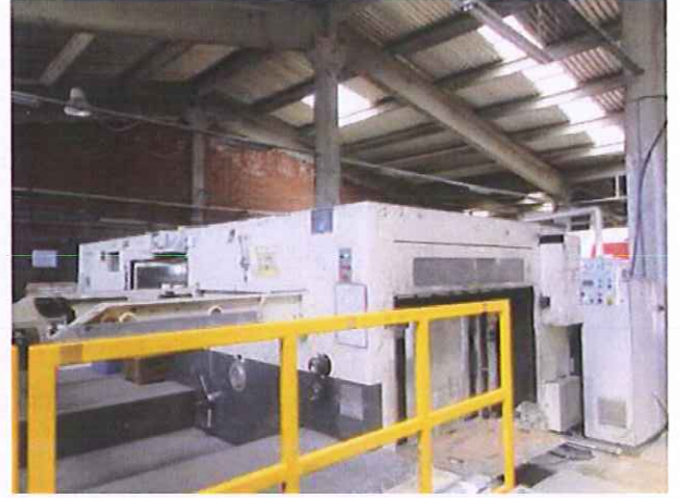
8) Levha Kesim Makinesi