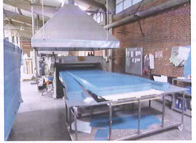
3) 3.Üretim Hattı