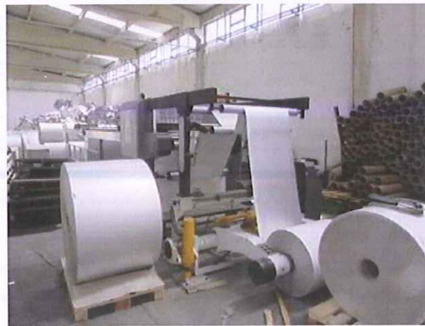
14) Bobin Kesim Makinesi