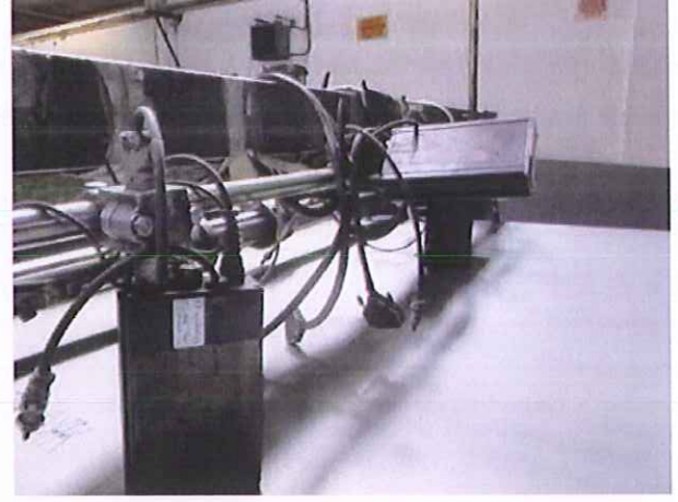
11) Levha Yazı Makinesi