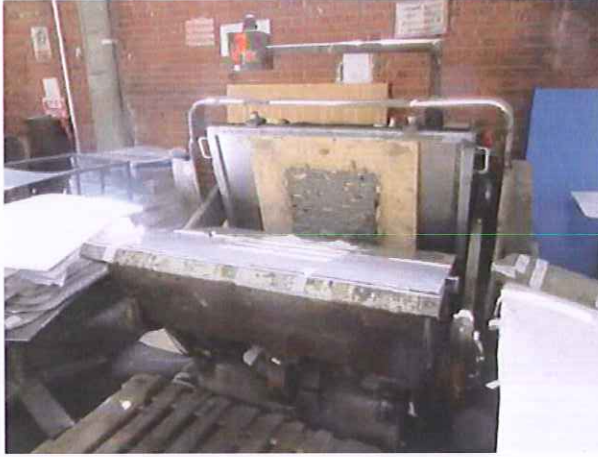
7) Levha Kesim Makinesi