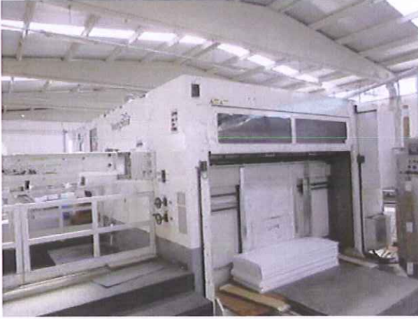
18) Levha Kesim Makinesi