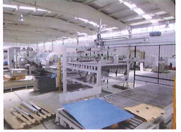
23) Kenar Kapama Makinesi