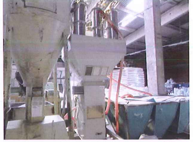
17) Dozajlama Ünitesi