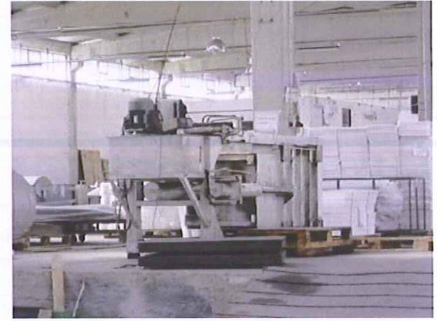
21) Atık Sıkıştırma Presi