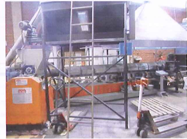
15) Granül Makinesi