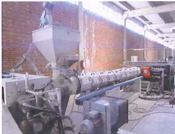
9) 4.Üretim Hattı