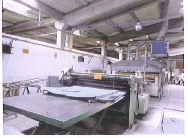
1) 1.Üretim Hattı