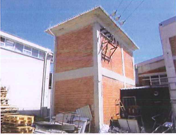
4-5) Trafo Tesisatı