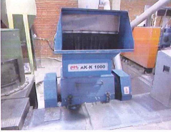
16) Kırma Makinesi