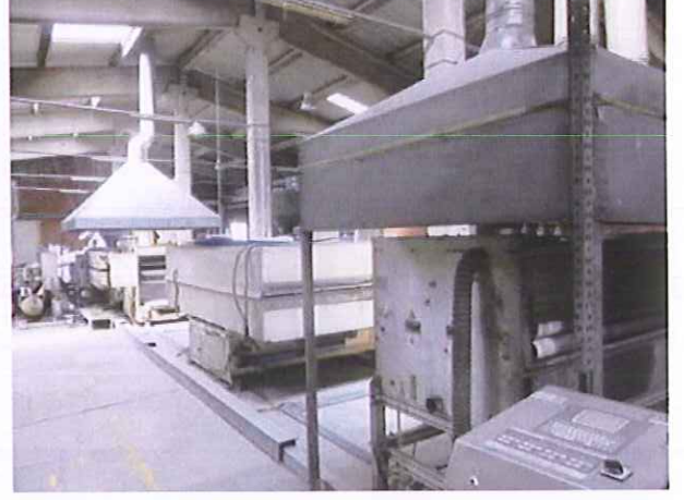
2) 2.Üretim Hattı