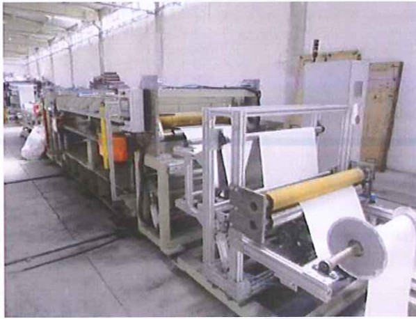
20) Bobin Kesim Makinesi