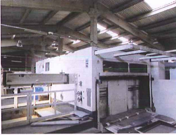
10) Levha Kesim Makinesi